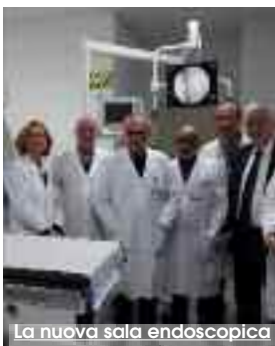
La nuova sala endoscopica