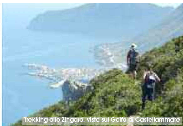
Trekking allo Zingaro, vista sul Golfo di Castellammare

le persone e gli altri elementi che caratterizzano un territorio dal forte potenziale come quello della principale delle isole dell'arcipelago. Insieme a docenti esperti e all'esperienza di operatori del settore, si cercherà di comprendere e far emergere il mix di azioni e strategie necessarie per un corretto sviluppo dei territori e di immaginare e realizzare prodotti e servizi turistici sostenibili. «La qualità dell'offerta turistica e la sostenibilità del nostro modello di turismo - ha dichiarato il Presidente dell'AMP e Sindaco di Favignana, Giuseppe Pagoto - sono condizioni necessarie, quasi obbligate, nel nostro territorio, un arcipelago che punta su bellezza e natura. Siamo convinti che si possa