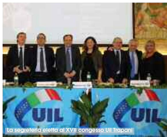
La segreteria eletta al XVII congresso Uil Trapani

ad oggi sono mancati. Per uscire dalla crisi, il cui prezzo più alto viene sempre fatto pagare ai lavoratori, occorre far ripartire gli investimenti, troppo spesso al palo, con progetti specifici e strutturali, e uno degli elementi determinanti perché ciò avvenga è, appunto, la riduzione del costo del lavoro». «I segnali di ripresa che si sono registrati al Sud negli ultimi 2 anni - secondo Tumbarello - sono il frutto di fattori legati anche alla chiusura dei cicli di programmazione dei fondi comunitari e quindi difficilmente si potranno presentare nel prossimo futuro con le stesse caratteristiche. Ma se la crescita del Sud negli ultimi due anni si è in qualche modo consolidata, la strada per recuperare il terreno perduto e per ridurre la forbice con il resto del Paese è ancora molto lunga, e per far ciò occorrono interventi che contengano misure coerenti tra loro e soluzioni innovative per dare speranza e futuro alle persone, partendo dalle giovani generazioni». Considerazione sostenuta da un dato che Tumbarello ha reso noto nel corso del suo intervento: l'emorragia di risorse umane rischia di creare un ulteriore depauperamento del Sud, dal momento che ben il 72,5% dei giovani che emigrano sono lau-