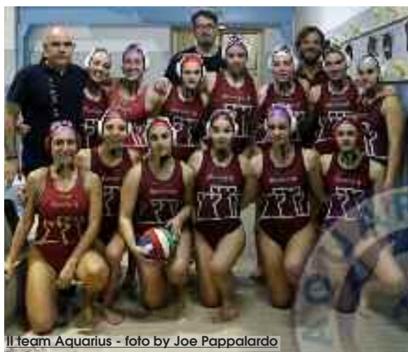
Il team Aquarius

dra e dello staff. Il settore femminile dell'Aquarius Trapani è in continua espansione, partendo dalle Under 9 fino alla B, con molte ragazze di prospettiva e convocate nelle selezioni regionali. Come settore giovanile stiamo lavorando bene, avendo il bacino più ampio della Sicilia». Il prossimo impegno per l'Aquarius Trapani è fissato per domenica 25 marzo, quando sarà in scena ad Acicastello per affrontare la Brizz Nuoto. Dal settore giovanile dell'Aquarius Trapani sono arrivate pure delle gioie nello scorso fine settimana. Per il maschile vittorie per Under 17 e 13, rispettivamente a Terrasini e Palermo per 8 a 6 e 9 a 5. Successo anche nel femminile con le Under 15,